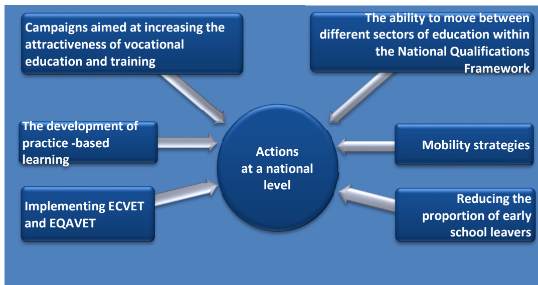
Figure 1. Exemplary activities to support vocational education at a national level

Fuente: Joanna Basztura "Política Educativa de la Comisión Europea en el ámbito de la educación y la formación profesional, 2014 - 2020". Presentación de Lodz, 15 de octubre de 2014; Política Educativa Desk Officer (Polonia, Lituania, Dinamarca), Comisión Europea, Dirección General de Educación y Cultura, Unidad A2: Análisis de los Países.